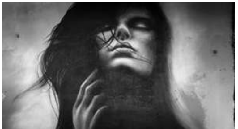
Graff grand format