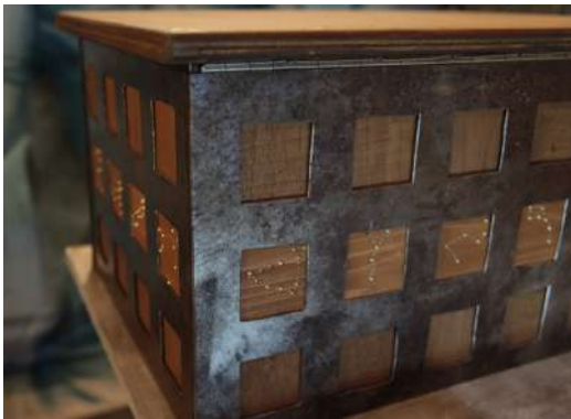
Création de mécanisme