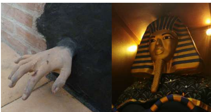
Travail moulage plâtre et fausses matières